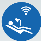
ZI LIVE CLINICAL

Póngase en contacto con nosotros para más información sobre próximos programas de formación: