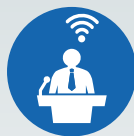
ZI LIVE WEBCASTS