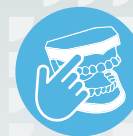
ZI IMPLANT SKILLZ ® SERIES