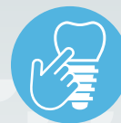
ZIPATHWAYZ ® PROGRAMS