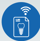
ZI LIVE CASE PRESENTATIONS