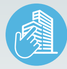
ZIMVIE INSTITUTE PROGRAMS